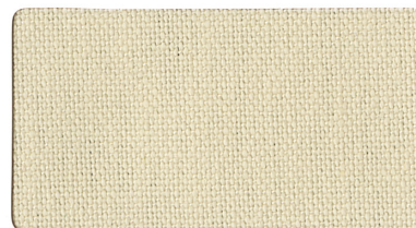
▲ ベージュ 水平用 A0830070(ニ)ラベル