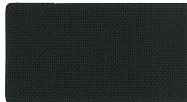
▲ 黒 A1130057(ニ)ラベル 地絛用