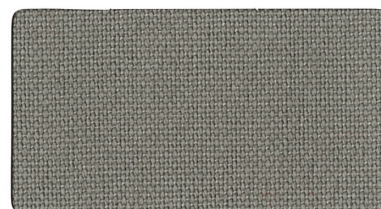
▲ グレー A1130057(ニ)ラベル 地絛用