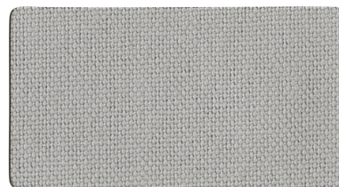
▲ ブルーグレー 水平用 A0830070(ニ)ラベル