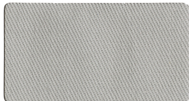
▲ 薄グレー A1130058(ニ)ラベル 8000-1