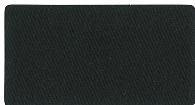
▲ 黒 A1130060(ニ)ラベル 7080-1