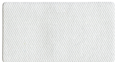
▲ 白 A2170010(ニ)ラベル 7120