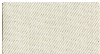
▲ 生成 A1130036(ニ)ラベル