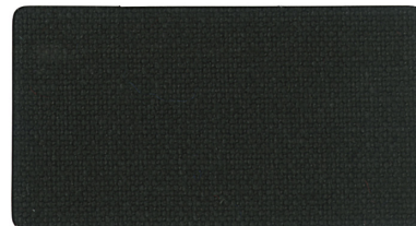
▲ 高密度 黒 A2120384(ニ)ラベル